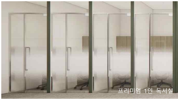
프리미엄 1인 독서실